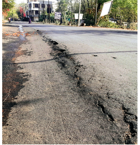
इंका कार्यालय के सामने भी यही स्थिति

दिन के साथ ही रात के समय उक्त ढलान वाले मार्ग पर दुर्घटनाओं की ज्यादा संभावना बनी हुई है। खिलचीपुर नाके तरफ से तेज रफ्तार में आने वाले बाइक चालक यहां अस्तुलित होकर घायल हो सकते हैं। उल्लेखनीय है कि पूर्व में यह मार्ग लोक निर्माण विभाग के अधीन आता था जिसे अब नगर पालिका ने अपने हैंडओवर ले लिया है।